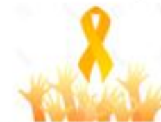
Childhood and AYA cancer