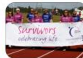
Living with and beyond cancer