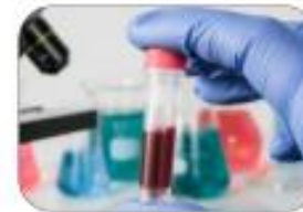
Pathology and molecular diagnostics