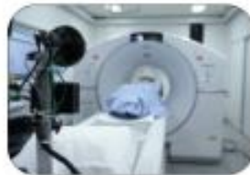
Imaging and nuclear medicine