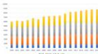
Cancer data and research