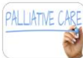
Palliative and end-of-life care