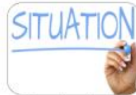
Organisation of cancer care