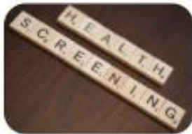
Early detection Screening